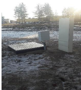
Kuva: Hulevesipumppaamo asennettuna.

Hulevesijärjestelmästä valmistui elokuun loppuun mennessä 2020 valmiiksi. Hulevesipumppaamo on asennettu paikoilleen ja Öljyneroituskaivo on asennettu paikoilleen viikolla 23. Purkutupki asennettiin maastoon ja saatiin valmiiksi syyskuun loppuun mennessä 2020.