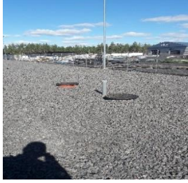
Kuva: Öljyneroituskaivot asennettuna.