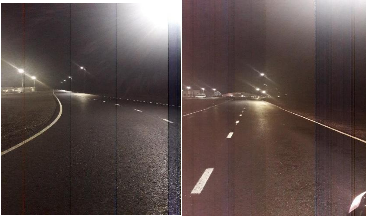
Kuvia: Maustetien uudet katuvalot.

Tievalaistuksen rakentamista on jatkettu heinäkuussa 2020. Katuvalaistus saatiin valmiiksi syyskuun loppuun mennessä.